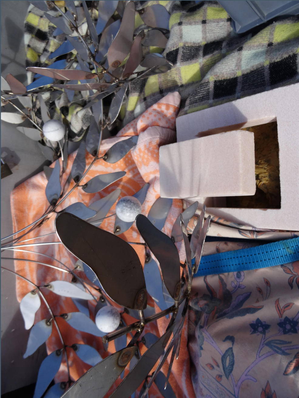
Autora: Carmen Vitorino