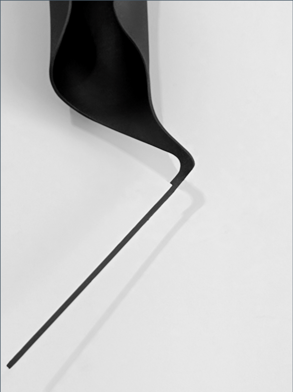
Autor: António Ferreira